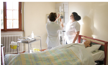
Plateau de formation clinique et technique